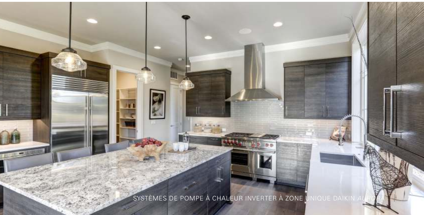
SYSTÈMES DE POMPE À CHALEUR INVERTER À ZONE UNIQUE DAIKIN AURORA

L'utilisation de la marque AHRI Certified® indique la participation du fabricant à un programme de certification. Pour vérifier la certification de produits spécifiques, rendez-vous sur www.ahridirectory.org